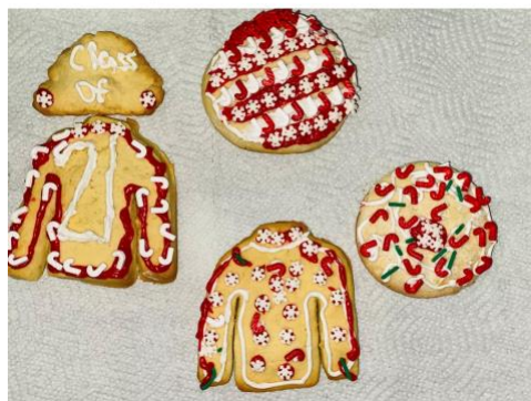
Rachel's cookies :)

Gracias a todos los participantes que hicieron deliciosas galletas.